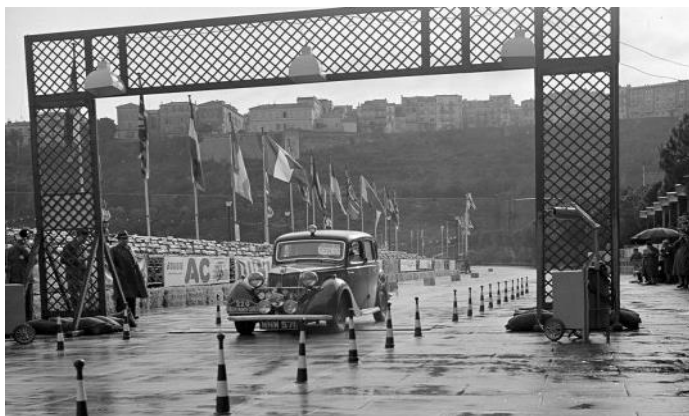
Rallye Monte Carlo 1951 (à gauche)

https://www.youtube.com/watch?v=hTCZJ7mQJdc