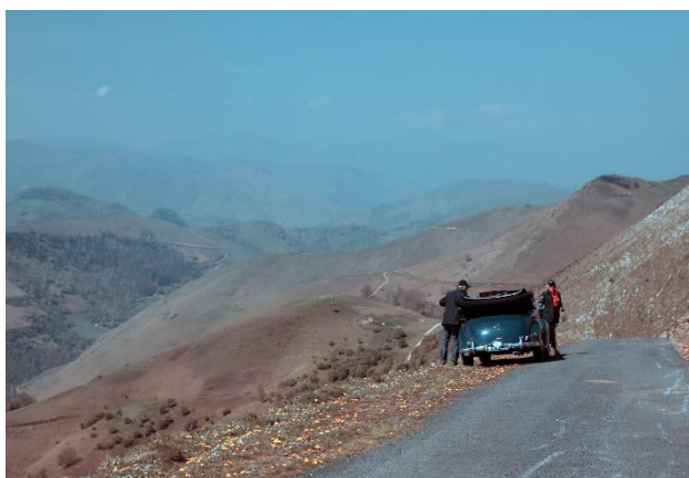
Impressions du parcours

Lorsque le tracé du GP longeant la côte (comme à Monaco) a été définitivement fermée et ouverte à la circulation à la fin des années 70, une nouvelle piste de course a été construite à l'intérieur des terres : le circuit de Grobnik. Bien sûr, nous y serons également ainsi qu'au Red Bull Ring plus tard en Autriche, que nous voulons définitivement intégrer.